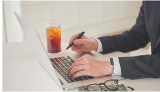
2 희망 직무 분석