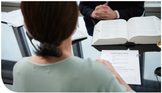
3 맞춤형 취업 컨설팅