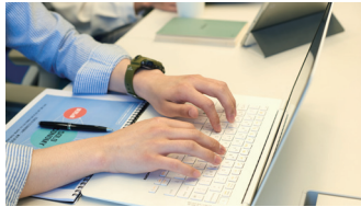
4 취업역량 개발

빌드업 및 점프업 활동 유형에 따라 최소 5만원~최대 20만원 수당 지급